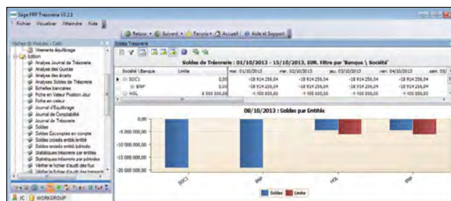
Indicadores de seguimiento de su actividad